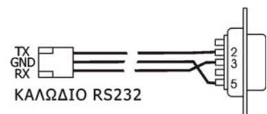
Σχήμα 2: Καλώδιο RS232

19200 baud, 8 bit, no parity. Transmit delay = 40msec/char.